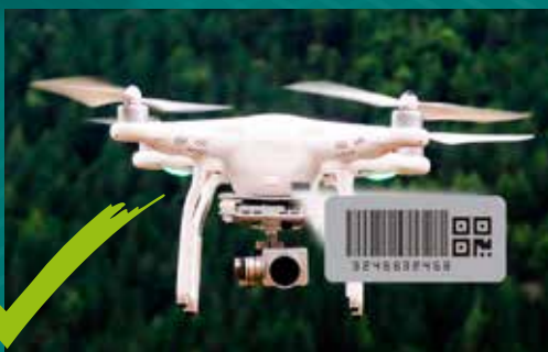
Foto meramente exemplificativa – este código de barras não pertence a esta aeronave

A foto ao lado também é recomendável porque possui um destaque do código de barras da aeronave que permite identificá-la durante a fiscalização.